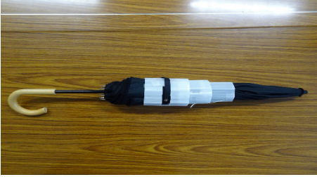
関東経済産業局長奨励賞