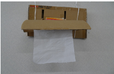
公益社団法人発明協会会長奨励賞